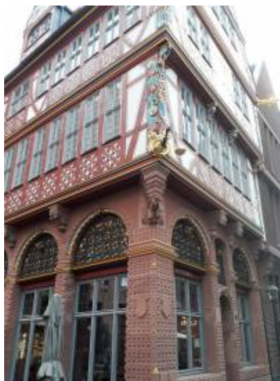
Abbildung 1: „Wir treffen uns vor der goldenen Waage“ eigene Aufnahme 2023

From: https://www.foc.geomedienlabor.de/ - Frankfurt Open Courseware