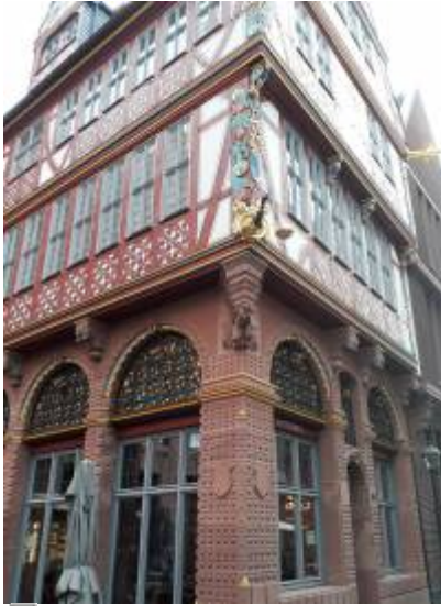
Abbildung 1: „Wir treffen uns vor der goldenen Waage“ eigene Aufnahme 2023

From: https://www.foc.geomedienlabor.de/ - Frankfurt Open Courseware