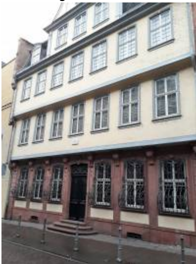
Abbildung 3: Adresse „Großer Hirschgraben 23-25, 60311 Frankfurt am Main“