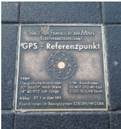
Abbildung 3: Koordinaten 50° 06,657' N 08° 40,912' E