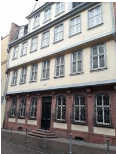
Abbildung 4: Adresse Großer Hirschgraben 23-25, 60311 Frankfurt am Main