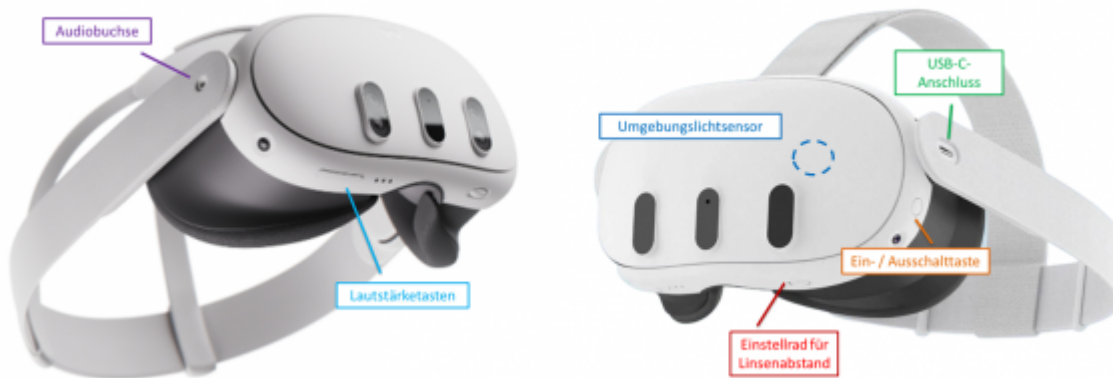
Abbildung 1: Aufbau des Headsets; eigene Darstellung verändert von links externe Verlinkung (10.10.2024) und rechts externe Verlinkung (10.10.2024)