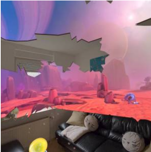
Abbildung 4: Mixed Reality bei First Encounters

Begrenzungen definieren den Bereich, in dem Sie sich gefahrlos während der Nutzung der VR-Brille bewegen können. Diese Begrenzungen werden in der VR-Brille hinterlegt.