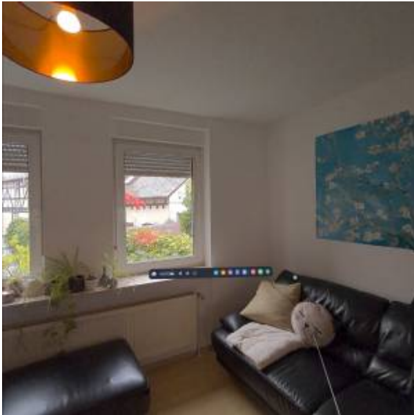
Abbildung 3: Passthrough