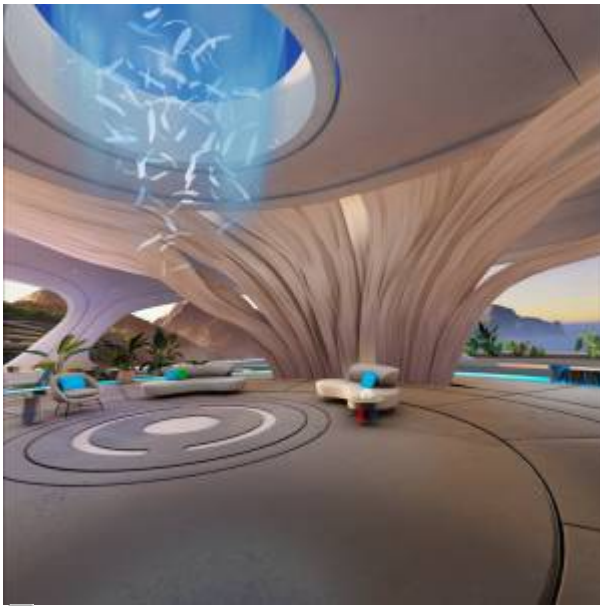
Abbildung 2: Immersiver Modus