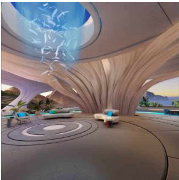
Abbildung 2: Immersiver Modus

Passthrough bedeutet, dass das Bild der Kameras der Brille auf deren Display angezeigt wird. Die Übertragung des physischen Raums geschieht etwas verzögert und besonders die Tiefendarstellung kann verzogen sein. Die Mixed Reality Umgebung ergänzt das projizierte Bild der physischen Welt mit virtuellen Inhalten und kombiniert somit beide Welten.