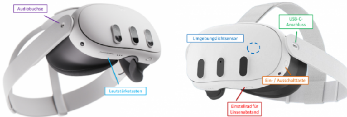
Abbildung 1: Aufbau des Headsets; eigene Darstellung verändert von links externe Verlinkung (10.10.2024) und rechts externe Verlinkung (10.10.2024)