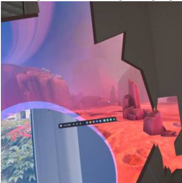
Abbildung 6: Aufnahme beim Überschreiten der Begrenzung

Begrenzungen können bei den Einstellungen unter Physischen Raum festgelegt oder bearbeitet werden.